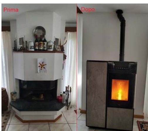
Sostituzione di un vecchio camino con una stufa a pellet in una casa unifamiliare a San Vittore (cliccare per ingrandire)

Anche se gli incentivi sono terminati, questi filtri si possono naturalmente ancora installare, per dare il proprio contributo alla riduzione delle polveri fini nella nostra regione.