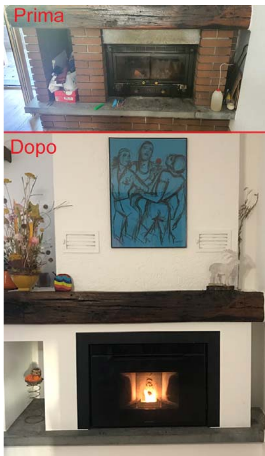
Sostituzione di un vecchio camino aperto con un inserto a pellet in una casa unifamiliare a San Vittore (cliccare per ingrandire)

Sono una trentina gli incentivi approvati a proprietari di immobili di Roveredo, Grono e San Vittore, i Comuni dove i limiti delle emissioni di PM10 venivano più spesso superati. Quest'azione si è conclusa il 31 dicembre 2020 e andrà a beneficio della qualità dell'aria e di tutta la popolazione.