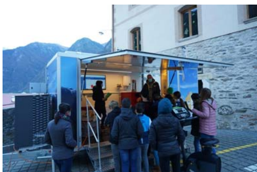
L'esposizione itinerante ENERGIE GR sul piazzale delle scuole di Roveredo in ottobre 2020 (cliccare per ingrandire)